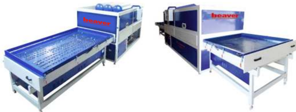
WV 2300A – 1Z